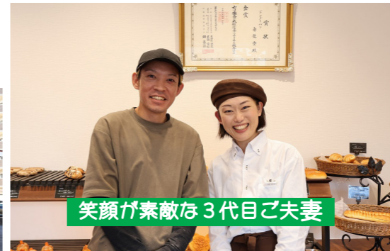
笑顔が素敵な 3 代目ご夫妻