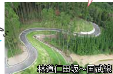
林道仁田坂~国武線