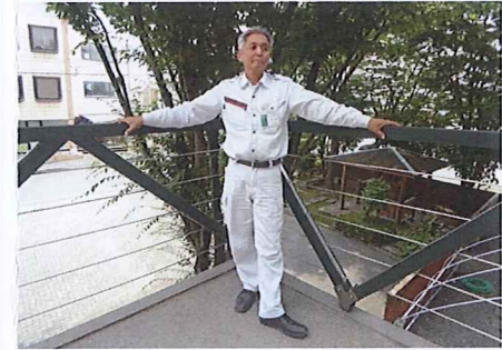
本社2階への外階段でパチリ☆

仕事をするうえでは、地元や協力業者の方々、その他、関係するすべての方の協力が不可欠。みなさんのおかげで仕事ができます。感謝を胸に、日々の仕事に取り組んでいます。