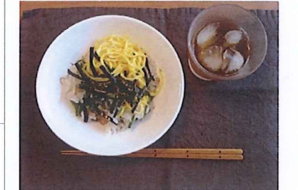
梅とちりめんがポイント！熱中症対策にどうぞ。錦糸たまごのほのかな甘さがたまりません！

①炊き立てのご飯に梅酢・ちりめん・ごまを入れさっくりと混ぜる。（米1合に梅酢大さじ1）②にがうりは縦四つ割して薄切り。塩でもむ。③②を硬く搾り、水気を出し、①に入れ混ぜる。④刻んだみょうがとしその葉を混ぜ、錦糸たまご、刻みのりをトッピングして完成！