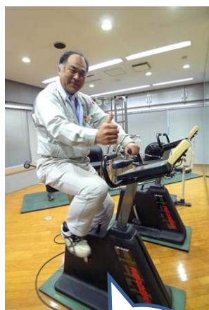
エアロバイクで体重調整中!!

春のこの時期。新生活にも徐々に慣れ、緊張感が和らぎ始めてきたのではないのでしょうか。そんな時期に今までの疲れやストレスがどっと出てくるもの。体調管理には充分気を付けてください。