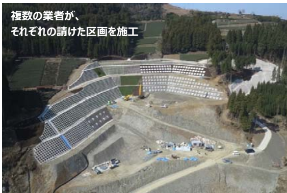
複数の業者が、それぞれの請けた区画を施工

工事名：星野川柳原地区下段部上流掘削法面工事 工期：平成25年6月25日～平成26年6月30日