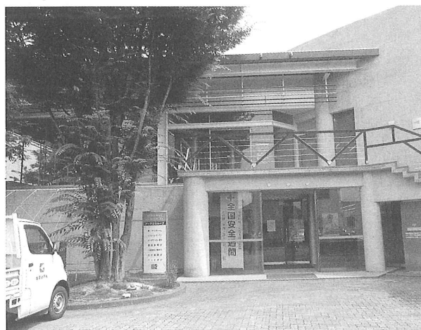
会議室やホールは地域にも開放しています

事務だけでなく、営業と技術系にも女性がいいます。「女だから」と言われることは無く考えたことも無いほど、とても働きやすいです。今後、働く上で課題がある場合でも、やる気をもって考えを伝えたら、きちんと受け止め検討してくれる会社です。